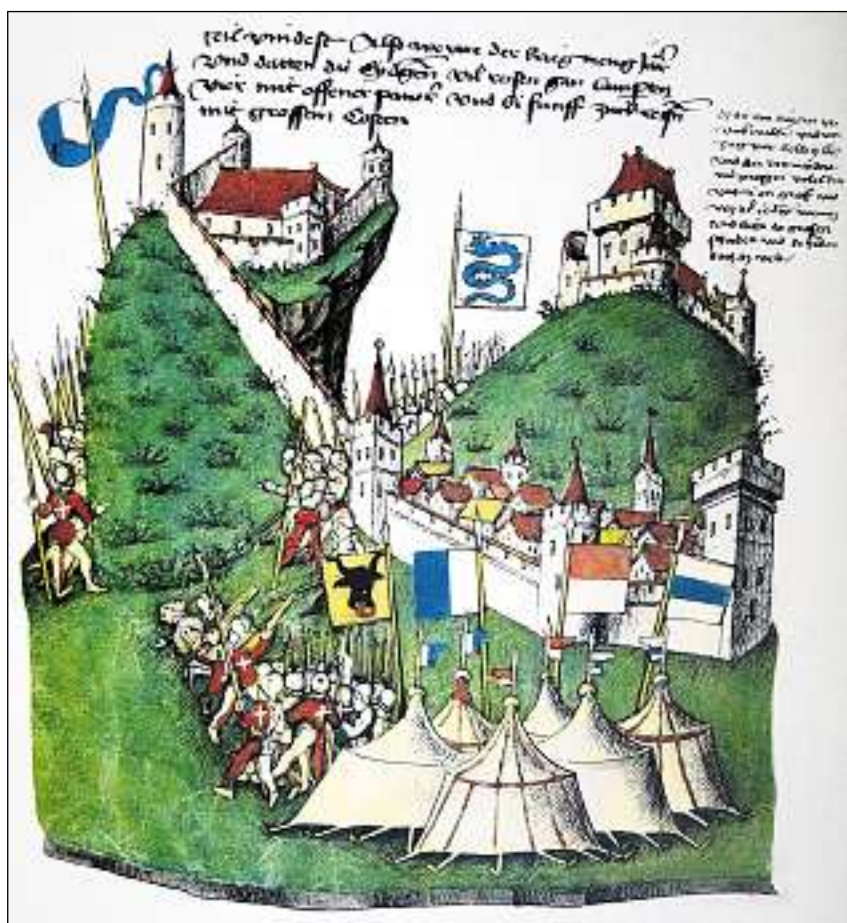
Ils Confederads davart Bellinzona. Represchentaziun da las fortezzas da Bellinzona en la cronica bernaisa da Benedikt Tschachtlan (1470).

Bellinzona è restà durant decennis in lieu cumbatti. Las fortezzas èn vegnidas occupadas e conquistadas pliras giadas. L'onn 1340 ha cumenzà per Bellinzona il domini milanais che ha durà in tschientaner e mez. Per proteger militarmain lur territori cunter las acziuns imprevisiblas dals Confederads han ils ducas milanais amplifitgà las veglias fortezzas ad ina serra da vallada strusch da conquistar. Probablmain già vers il 1350 è il chastè da Montebello vegni collià tras la miraglia cun il mir da tschinta da la citad. Pauc suenter il 1400 è